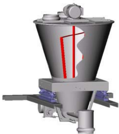
Встроенный в платформу